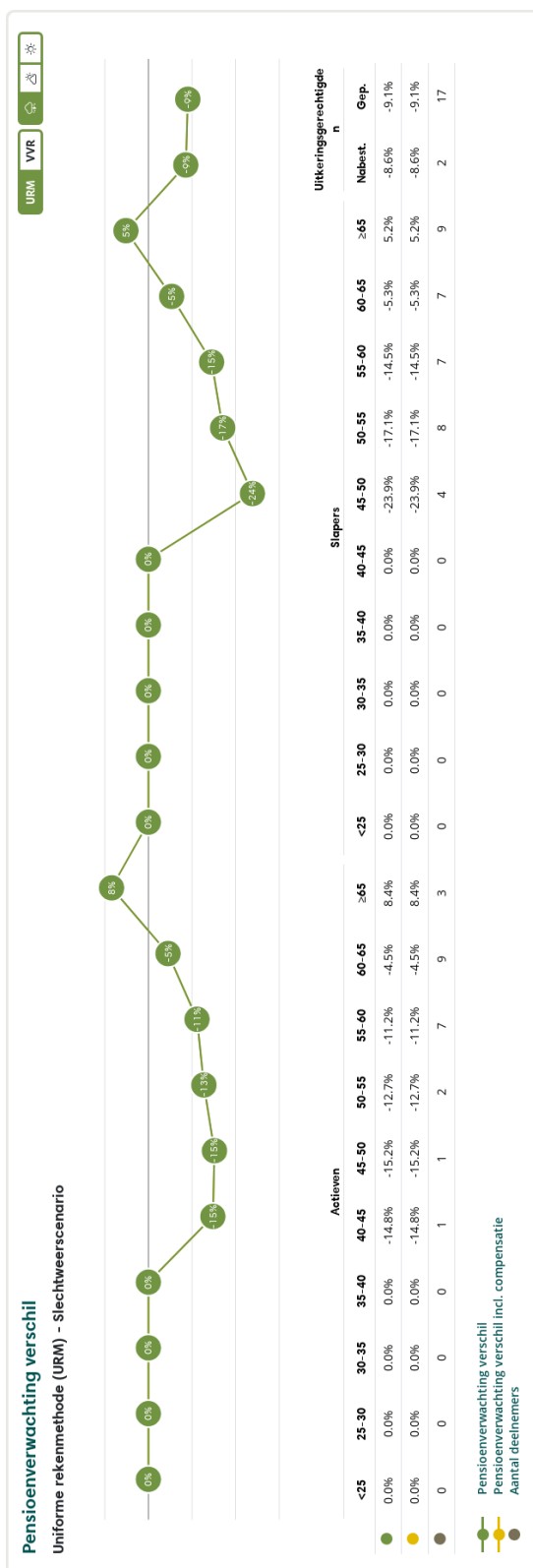
Figuur 2: Pensioenverwachting URM in het huidige slechtweersscenario bij invaren