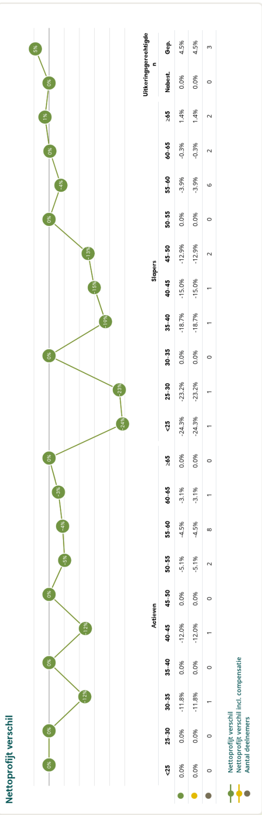
Figuur 4: Nettoprofijsverschil in het huidige scenario bij invaren