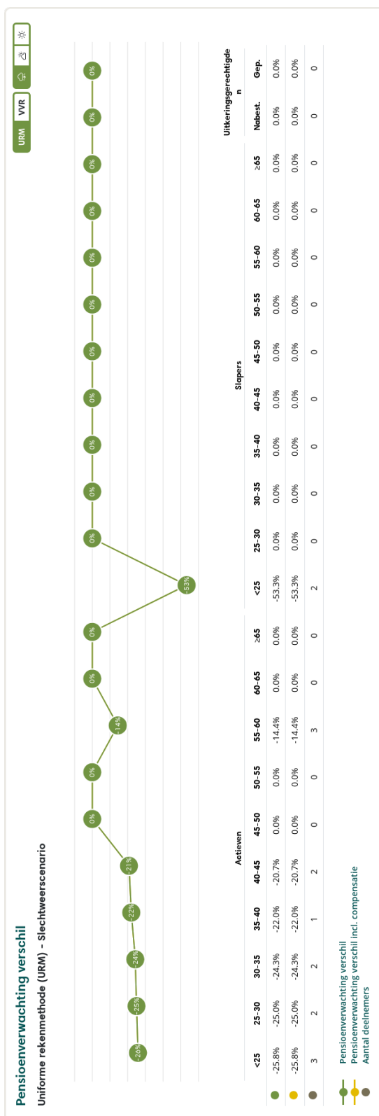
Figuur 2: Pensioenverwachting URM in het huidige slechtweersscenario bij invaren