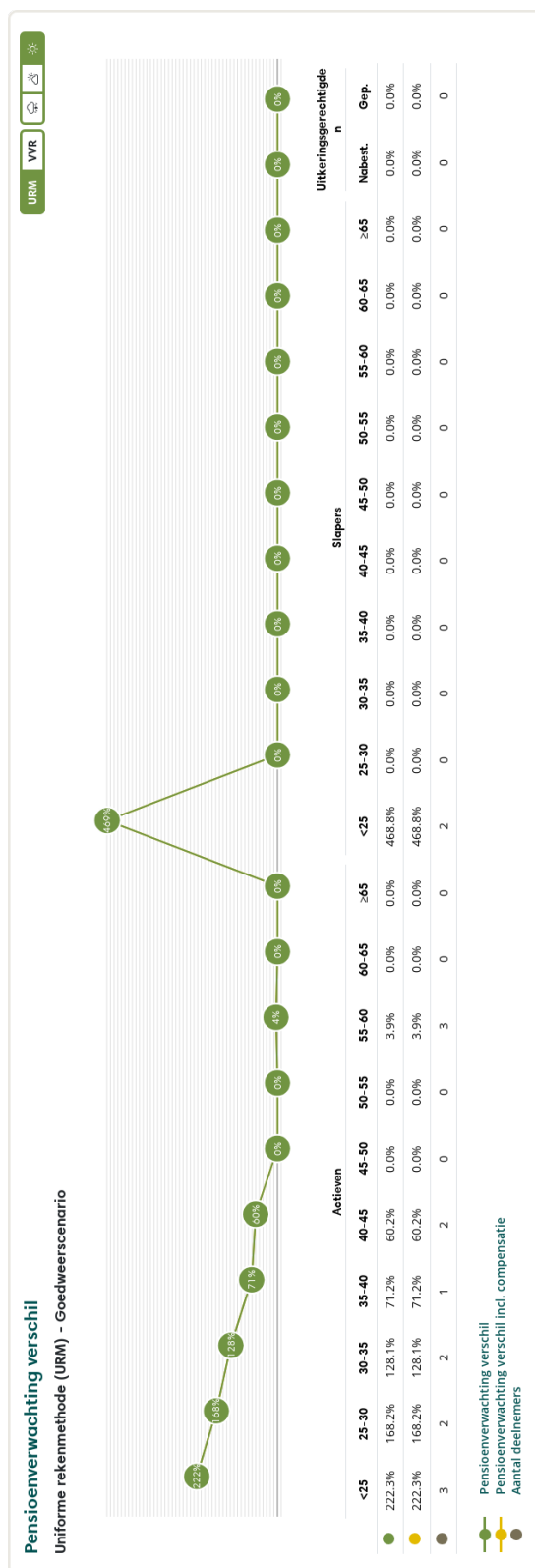
Figuur 3: Pensioenverwachting URM in het huidige goedweersscenario bij invaren