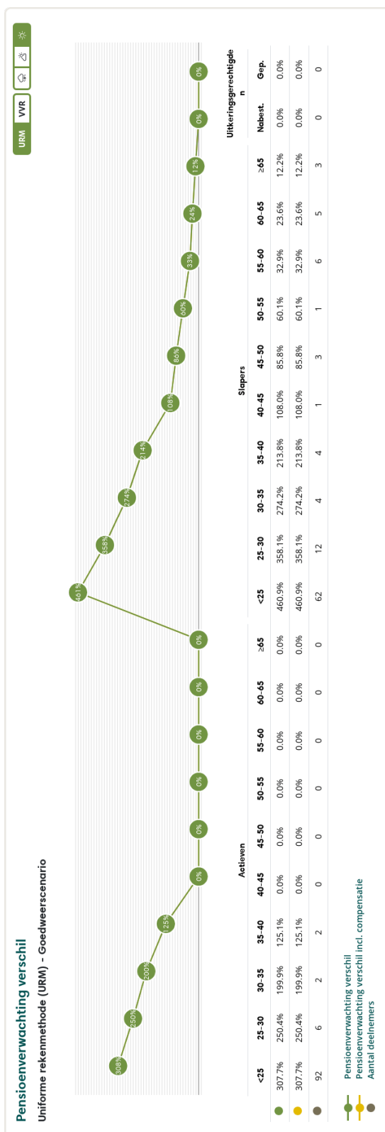
Figuur 3: Pensioenverwachting URM in het huidige goedweersscenario bij invaren