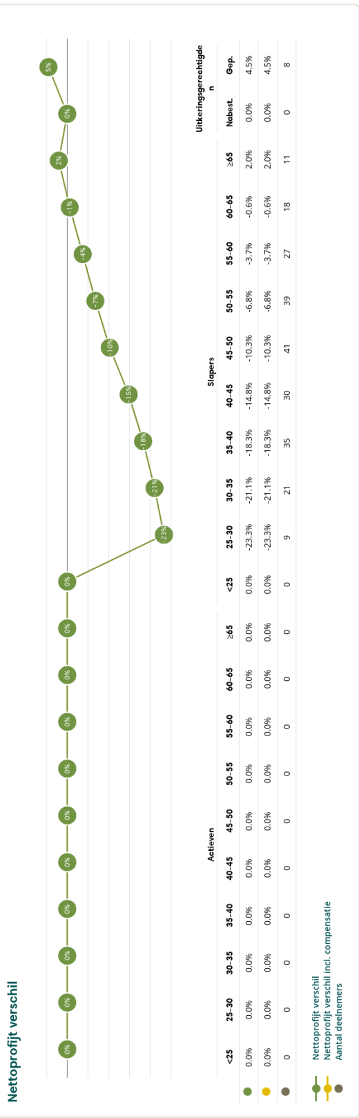
Figuur 4: Nettoprofijsverschil in het huidige scenario bij invaren