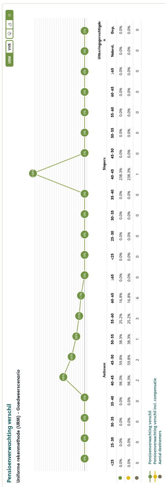
Figuur 3: Pensioenverwachting URM in het huidige goedweersscenario bij invaren