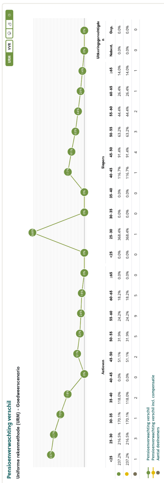
Figuur 3: Pensioenverwachting URM in het huidige goedweersscenario bij invaren