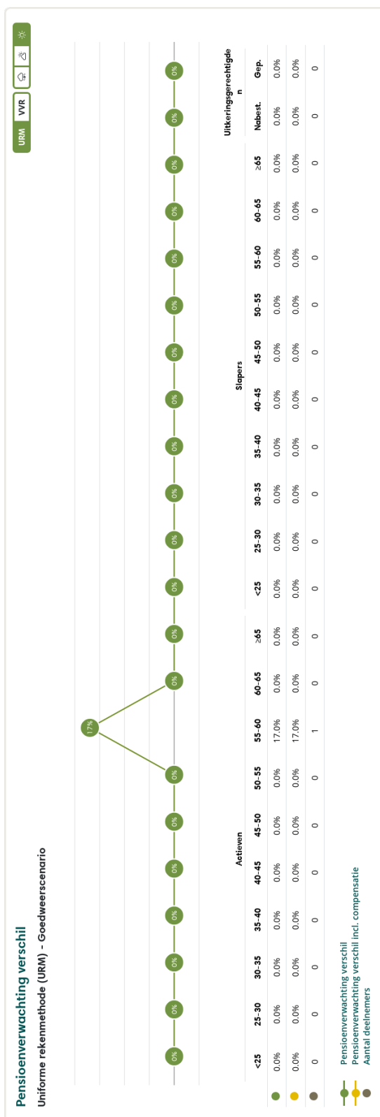
Figuur 3: Pensioenverwachting URM in het huidige goedweersscenario bij invaren