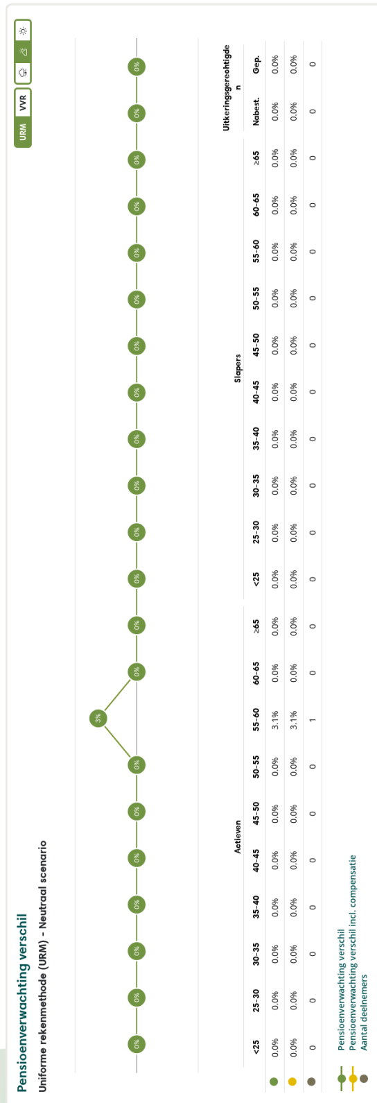
Figuur 1: Pensioenverwachting URM in het huidige neutrale scenario bij invaren