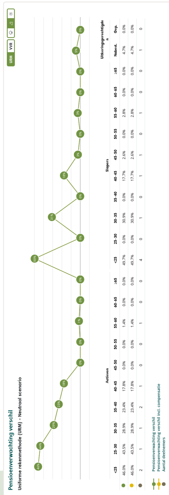
Figuur 1: Pensioenverwachting URM in het huidige neutrale scenario bij invaren