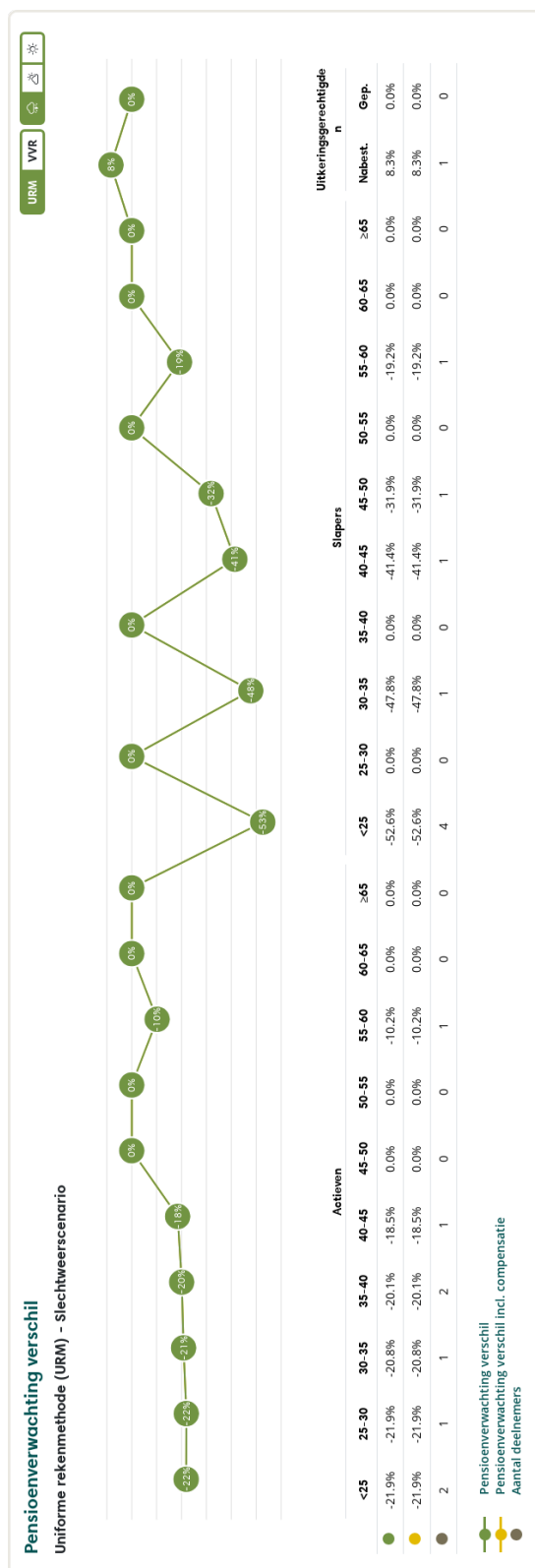
Figuur 2: Pensioenverwachting URM in het huidige slechtweersscenario bij invaren