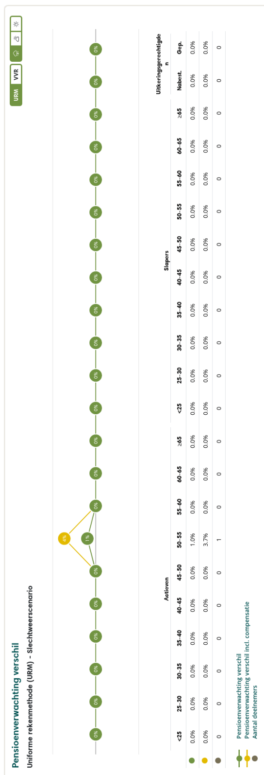
Figuur 2: Pensioenverwachting URM in het huidige slechtweersscenario bij invaren