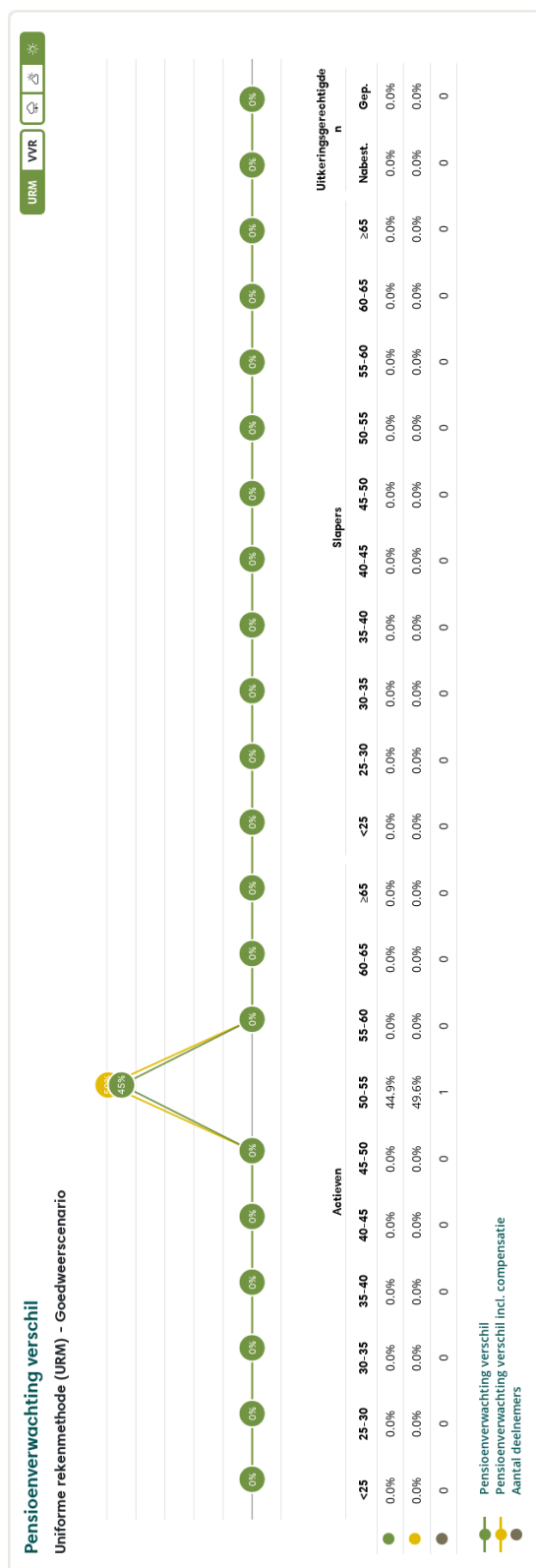
Figuur 3: Pensioenverwachting URM in het huidige goedweersscenario bij invaren