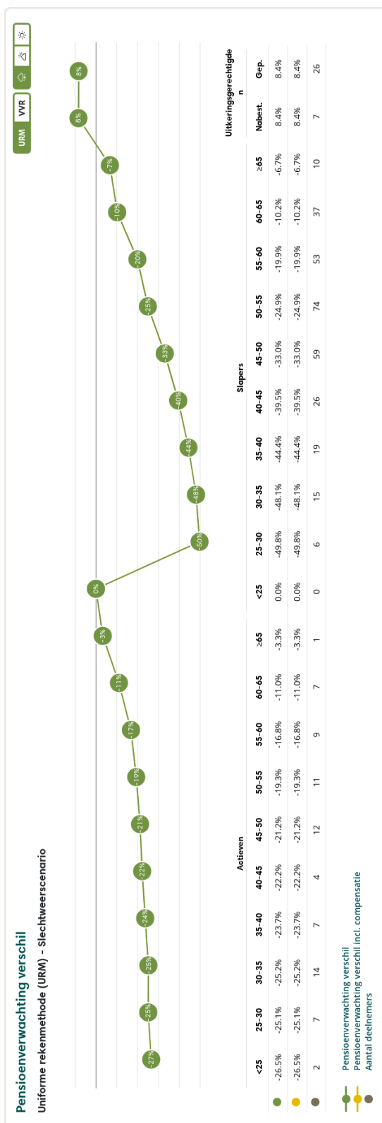
Figuur 2: Pensioenverwachting URM in het huidige slechtweersscenario bij invaren