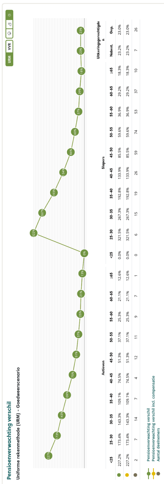
Figuur 3: Pensioenverwachting URM in het huidige goedweersscenario bij invaren