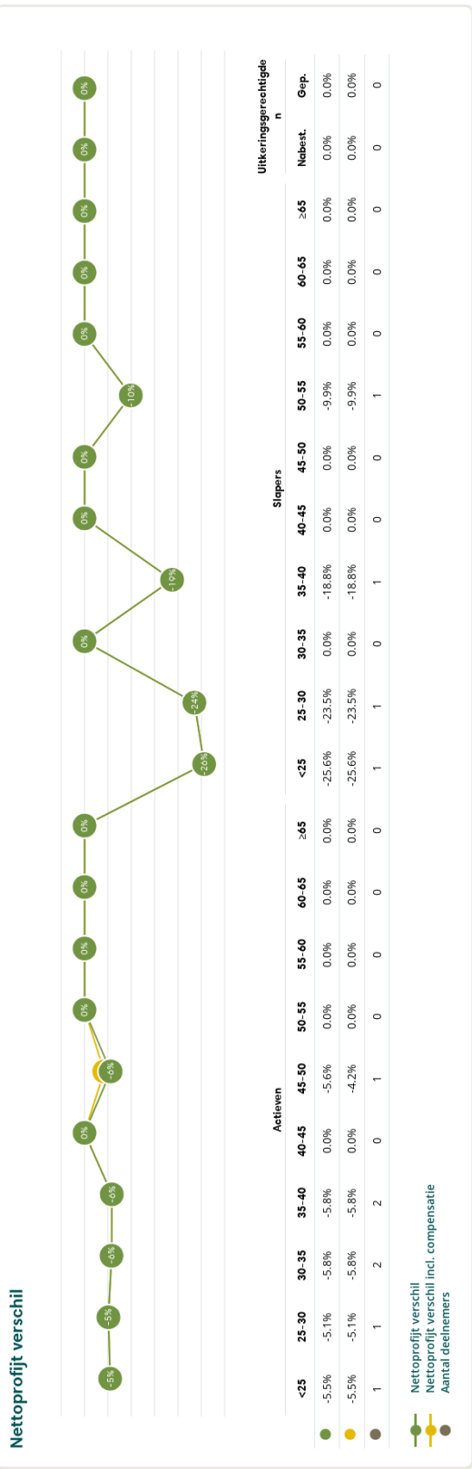
Figuur 4: Nettoprofit in het huidige scenario