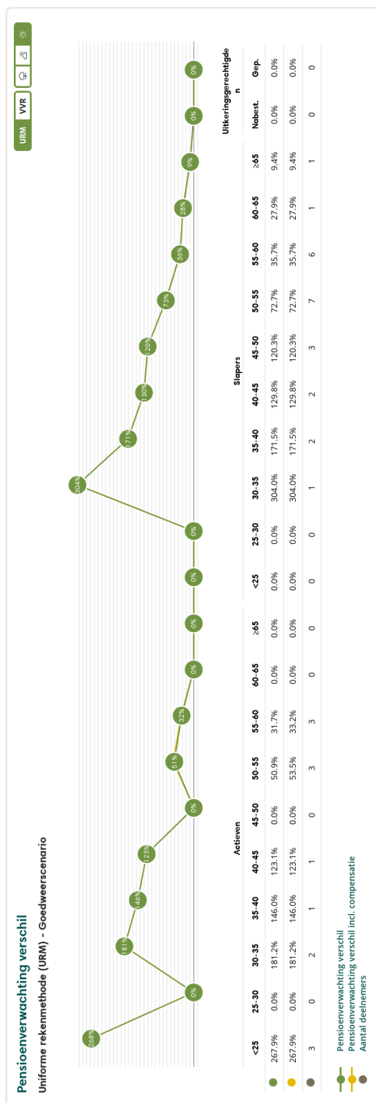
Figuur 3: Pensioenverwachting URM in het huidige goedweersscenario bij invaren