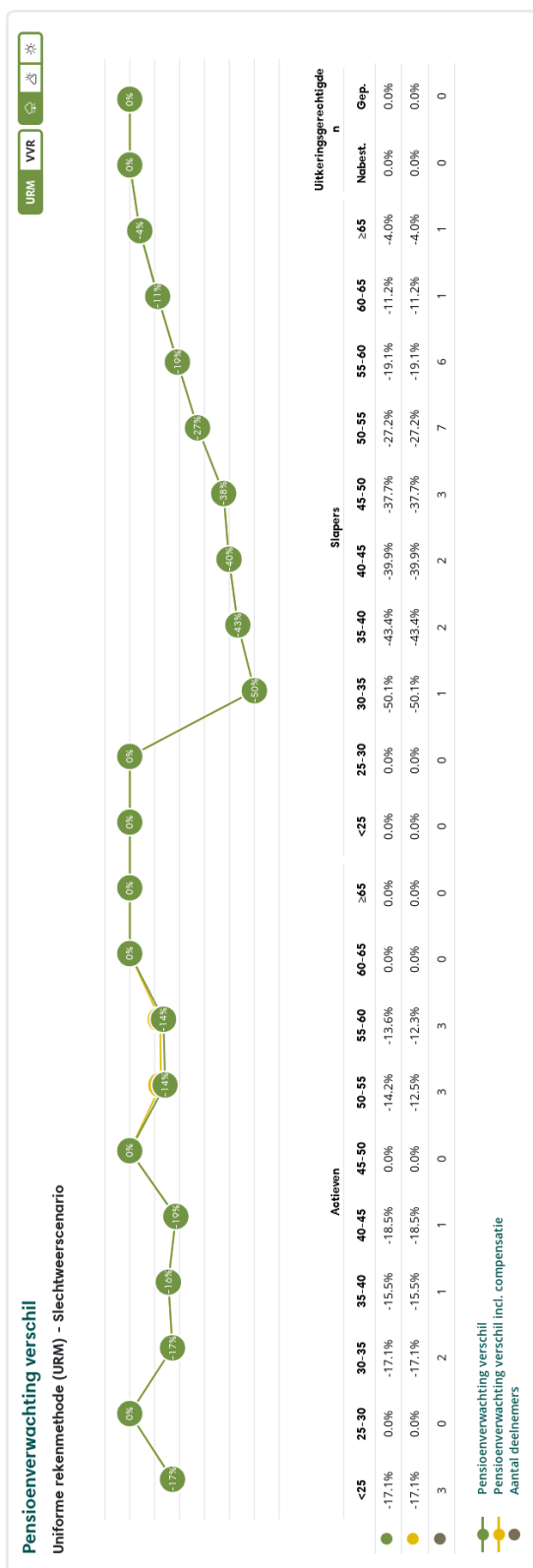
Figuur 2: Pensioenverwachting URM in het huidige slechtweersscenario bij invaren