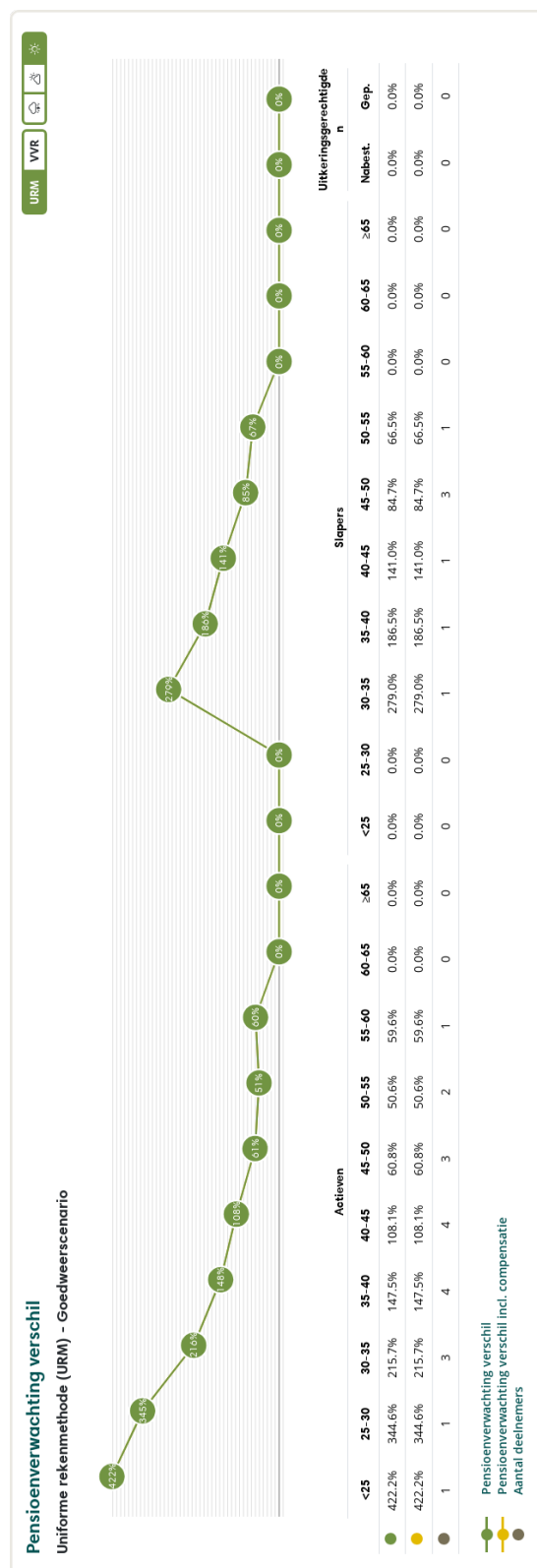
Figuur 3: Pensioenverwachting URM in het huidige goedweersscenario bij invaren