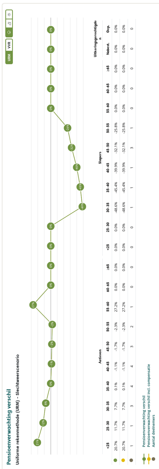
Figuur 2: Pensioenverwachting URM in het huidige slechtweersscenario bij invaren