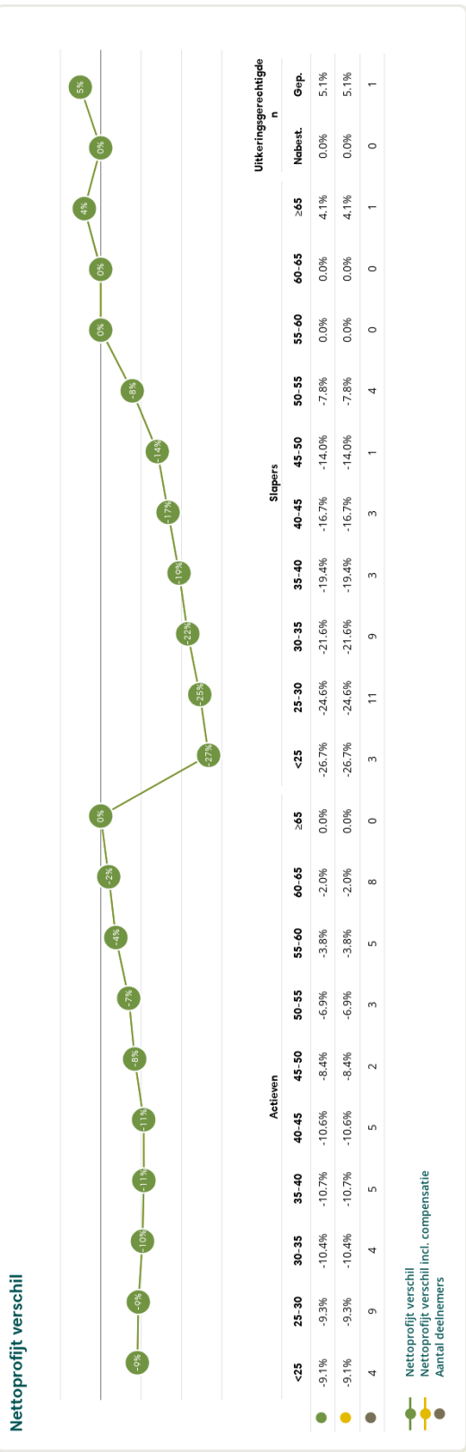
Figuur 4: Nettoprofijsverschil in het huidige scenario bij invaren