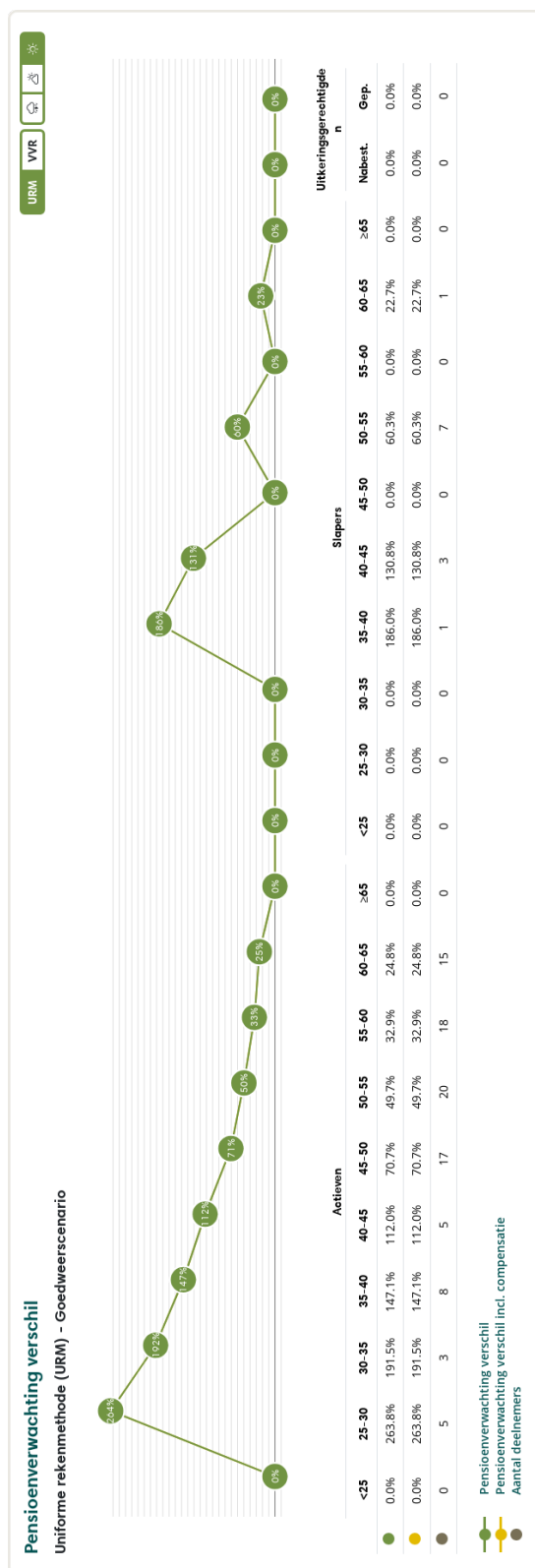
Figuur 3: Pensioenverwachting URM in het huidige goedweersscenario bij invaren