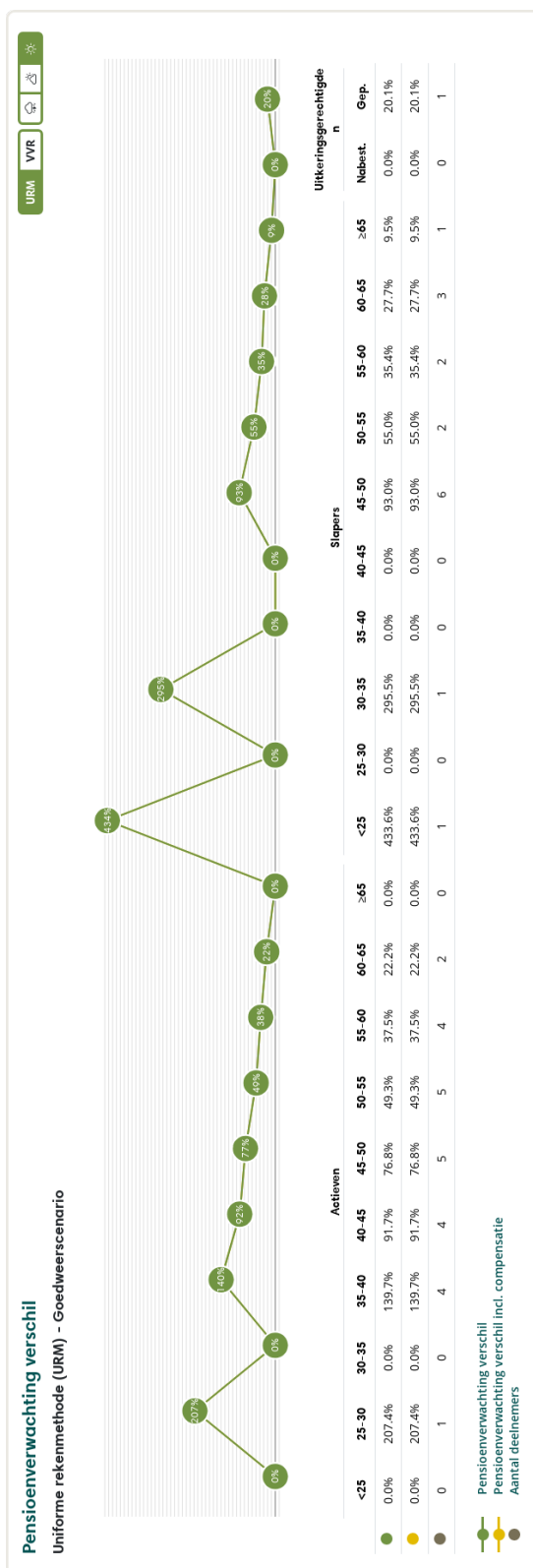
Figuur 3: Pensioenverwachting URM in het huidige goedweersscenario bij invaren